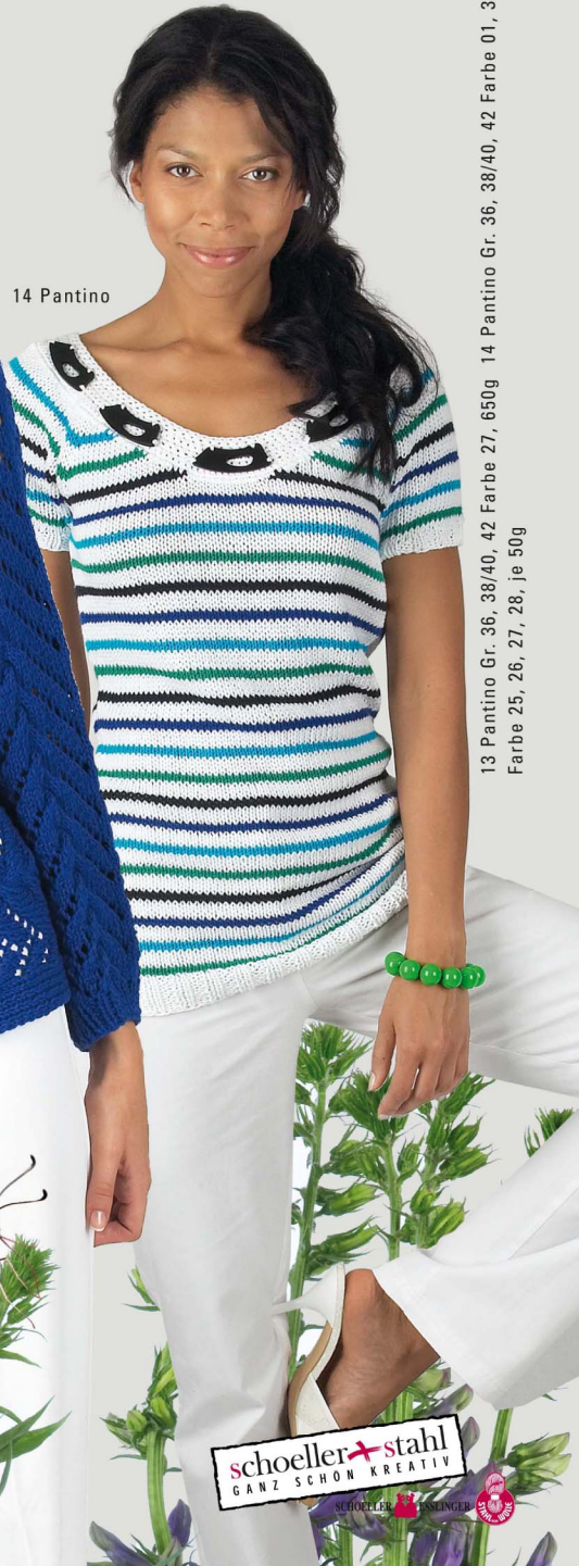
13 Pantino Gr. 36, 38/40, 42 Farbe 27, 650g 14 Pantino Gr. 36, 38/40, 42 Farbe 01, 300g Farbe 25, 26, 27, 28, je 50g